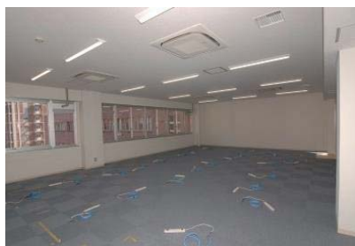
マルチメディア外国語演習室