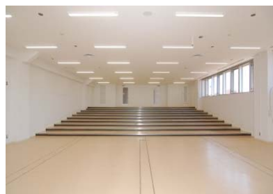
講義室(4F)耐震ハンチ設置