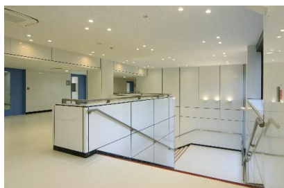
エントランスホール