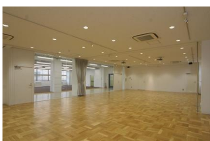
プレゼンテーションルーム